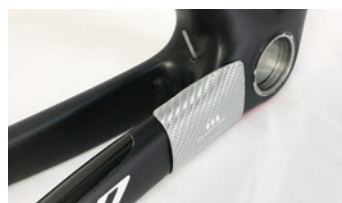
シルバーカーボン施工例