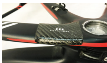
ブラックカーボン施工例

どんな形状のフレームにもぴったりフィット！ チェーン脱落時のフレーム傷付きを防ぎます。